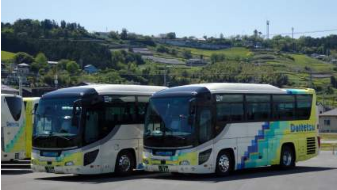
2019年度導入 502号車 503号車 金谷自動車営業所