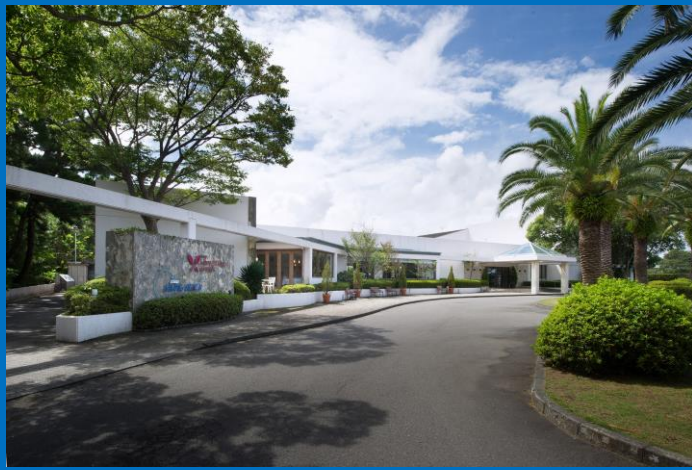
静波スウィングビーチ（外観）