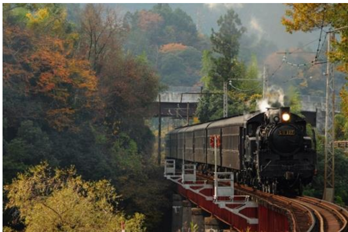
【大井川鐵道S L (イメージ)】