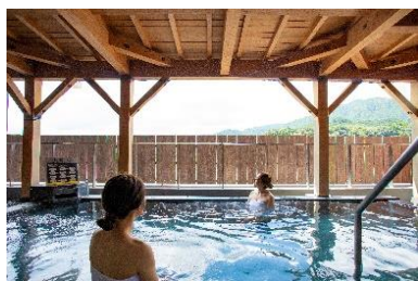
川根温泉ホテル・露天風呂

★2名様以上でお申込みください。大人1名様・幼児1名様でご利用の場合、幼児の方は小人代金となります。 ★お部屋のお布団はご自由にお使いいただけます(1部屋5組まで用意あり)。 ※幼児の年齢はご出発日当日の年齢となり、1歳~未就学児が対象です。(S L 座席あり・弁当あり・食事あり) ※0歳児S Lの座席が必要な場合は、幼児にてお申込みください。