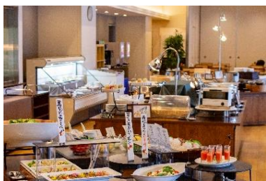
川根温泉ホテル お食事例