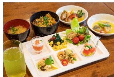
川根温泉ホテル お食事例