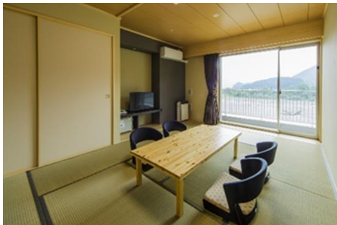
【川根温泉ホテル和室 (イメージ)】