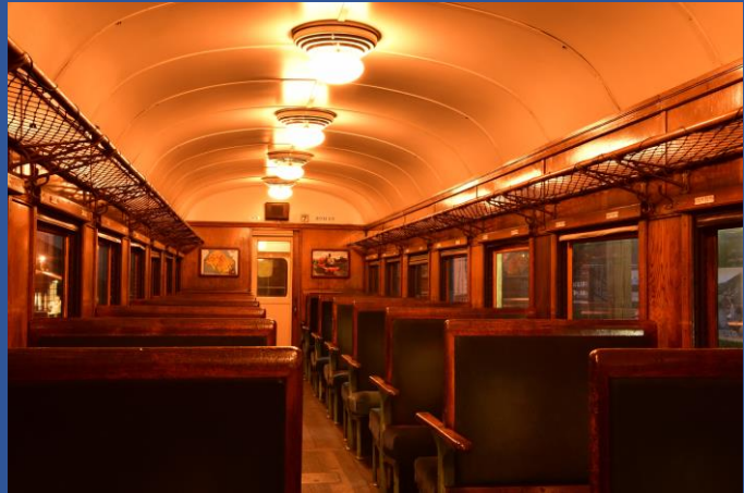
※写真画像はイメージです。